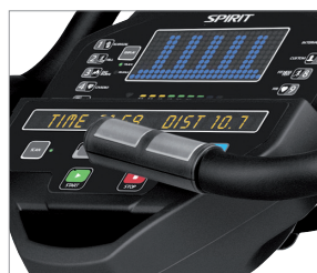
MEDIDOR DE RITMO CARDÍACO