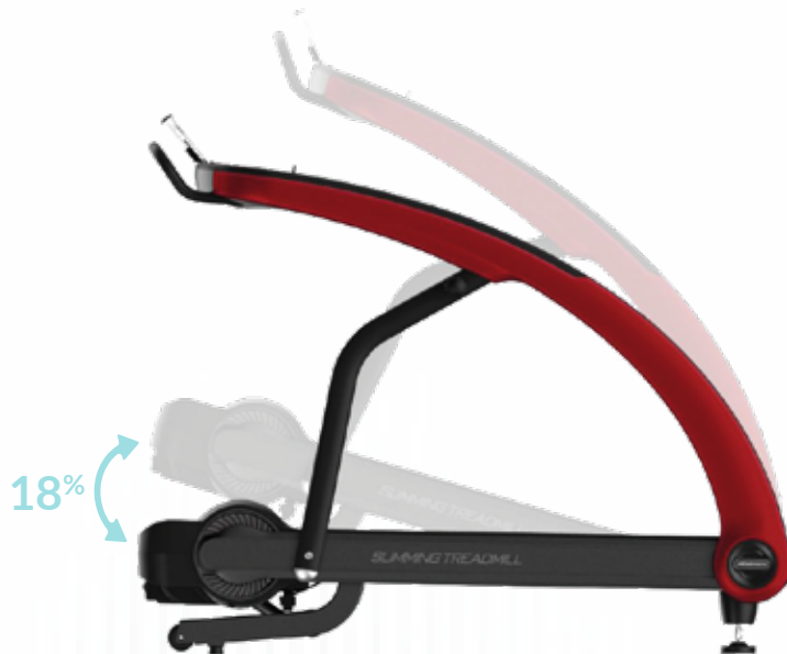
Inclinación del 0 al 18% Inclination from 0 to 18%

Soporte para tableta o teléfono. Tablet or smart phone holder.