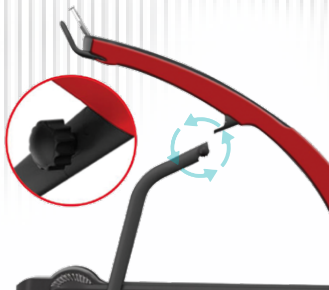
Pestillo de seguridad para plegarla Safety latch to fold

Capacidad de carga / Loading capacity: 20'/18 pcs, 40'/36 pcs, 40'HQ/48 pcs